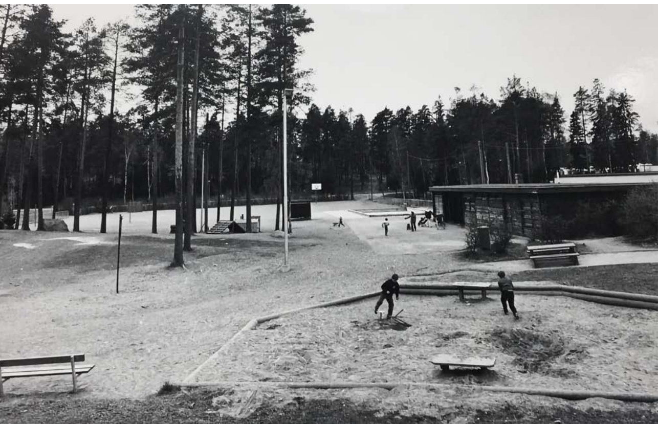
KUVA 2 Jakomäen leikkikenttä, 1976.

Helsingin kentät olivat suosittuja. Esimerkiksi vuonna 1978 kesäkuukausina kirjattiin kentillä noin 410 000 käyntiä. (Helsingin kaupungin kaupunkisuunnitteluvirasto, 1982, s. 74). Kenttien käyttömäärissä oli kuitenkin alueellisia eroja. Vuonna 1977 tehdyssä vertailussa esimerkiksi kantakaupungissa sijaitsevan Hesperian leikkikentän keskimääräiseksi päiväkävijämääräksi oli kirjattu 402 käyntiä, kun vastaava luku Koillis-Helsingin Jakomäessä oli 180. (Sauro & Syrjäläinen, 1978, s. 27.) Hesperian suurempia kävijämääriä selittävät osittain taloyhtiöiden vähäiset leikkikentät mutta myös se, että Etu-Töölön virkistysalueita käyttivät lähialueen asukkaiden lisäksi todennäköisesti muutkin kaupunkilaiset. Ehkä Jakomäessä myös runsas luonto tarjosi vielä kantakaupunkia enemmän vaihtoehtoisia leikkipaikkoja.